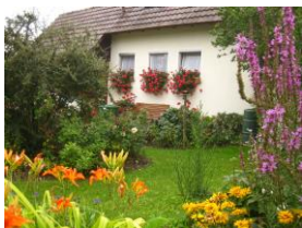
Mein schöner Garten

Blühende und fruchtende Gärten bereichern das Ortsbild und bieten durch ihre Artenvielfalt auch zahlreichen Tieren und Pflanzen wertvollen Lebensraum. Zur Prämierung vorbildlich gestalteter Gärten bietet die Kreisfachberatung für Gartenkultur und Landespflege drei Wettbewerbe mit verschiedenen Schwerpunkten zur Teilnahme für die Gartenbauvereine an: